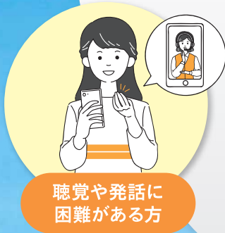
聴覚や発話に 困難がある方