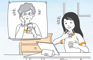
●家族や友人との会話