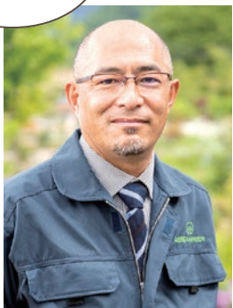
山梨県富士山科学研究所 主幹研究員 富士山火山防災研究センター長 博士(理学)