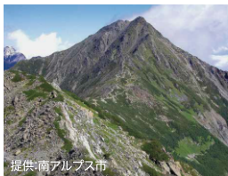
北岳 3,193m 富士山に次ぐ日本第二位の高峰。固有種の高山植物キタダケソウが自生しています。最寄り川:白根・南アルプス 南アルプス市観光商工課 055-282-6294