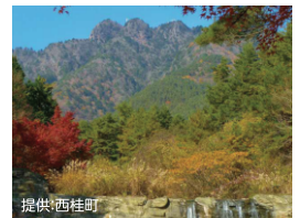
三ツ峠山 1,785m 富士山の展望、高山植物等で有名。石仏群もあり、信仰の山であった。最寄り川:都留・河口湖 西桂町産業復興課 0555-25-2121 富士河口湖町観光課 0555-72-3168 都留市観光協会 0554-43-1111代