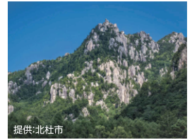
瑞牆山 2,230m 全山が花崗岩で形成された岩峰。トサカ岩等の数多くの奇岩石が並びます。最寄り川:須玉 北杜市観光・商工課 0551-42-1351