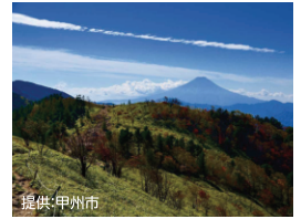
大菩薩嶺 2,057m 富士山をはじめ様々な山を展望出来ます。大菩薩連峰の盟主である。最寄り川:大月・勝沼 甲州市観光交流課 0553-32-5091 小菅村源流復興課 0428-87-0111 丹波山村復興課 0428-88-0211