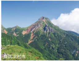
赤岳(八ヶ岳) 2,899m 八ヶ岳連峰の最高峰。山頂からの展望は抜群。最寄り川:小淵沢・長坂 北杜市観光・商工課 0551-42-1351