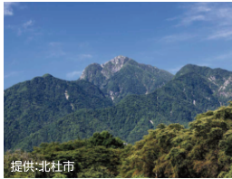
甲斐駒ヶ岳 2,967m 花崗岩から成り山肌が白く輝く。駒ヶ岳と名の付く山の最高峰。最寄り川:白根・南アルプス 北杜市観光・商工課 0551-42-1351