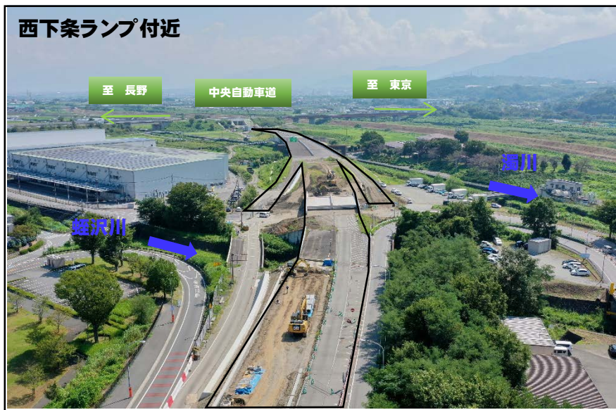
西下条ランプ付近