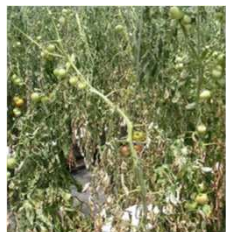
トマトかいよう病による萎凋症状