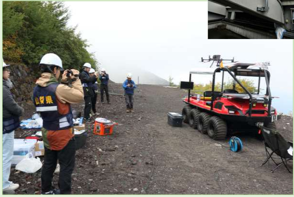
研究所内の2箇所に定点モニタリング用に設置したスターリンクアンテナ（左：研究棟、右：本部棟）

R3年度総務省実証実験で用いたものから更にコンパクトになったローカル5G基地局機材、スターリンク式をバギー車両に格納し、バギーの天板から離発着するドローンからの映像も伝送した。