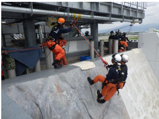
低所からの救助 (講師：RR河口湖ベース 貴家講師)