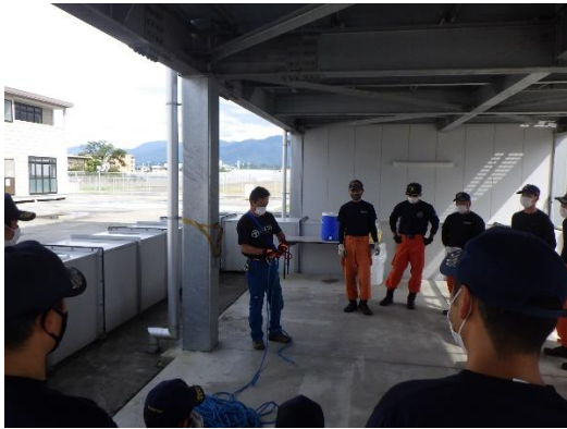
資器材の取扱い システム構築等