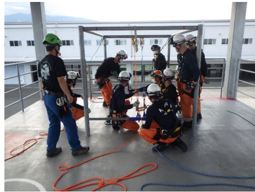
(講師：RR河口湖ベース 貴家講師)