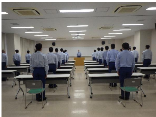
入 校 式