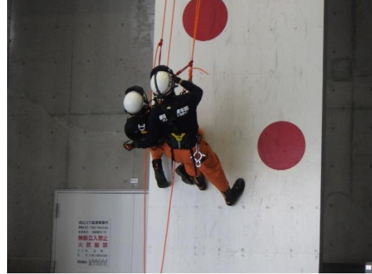
高所からの救助（講師：RR河口湖ベース 貴家講師）