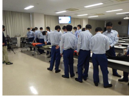
安全管理 (講師：(株) fine track )