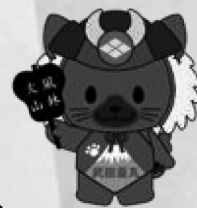
山梨県 観光キャラクター 武田ひし丸