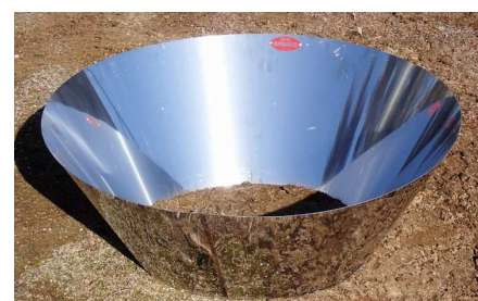
図2 炭化器(株)モキ製作所製 ※直径 100 cm

※農林水産省委託の農地土壌炭素貯留等基礎調査事業におけるデータ ※県内の果樹園 25 地点における土壌炭素量を数年おきに調査 ※土壌表面から 30 cm までの土壌炭素貯留量を測定 ※全地点平均は土壌タイプ別内訳の加重平均