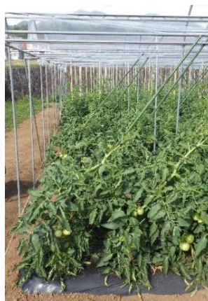
図2 斜め誘引したトマト栽培の様子