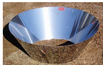
図2 炭化器(株)モキ製作所製 ※直径 100 cm

※農林水産省委託の農地土壌炭素貯留等基礎調査事業におけるデータ ※県内の果樹園 25 地点における土壌炭素量を数年おきに調査 ※土壌表面から 30 cm までの土壌炭素貯留量を測定 ※全地点平均は土壌タイプ別内訳の加重平均