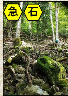
急坂で砂や石が落ちてくるので注意。