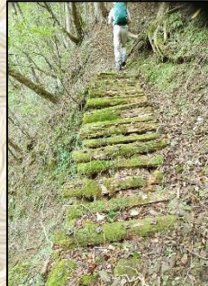
不安定で穴があいている箇所があるので、つまづきに注意。