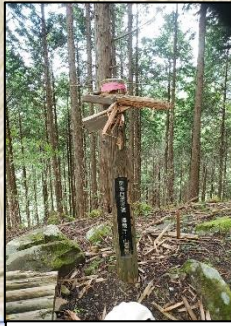
熊の引っ掻き傷があるので注意。