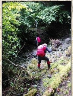
道が荒れているので、通行時に注意。