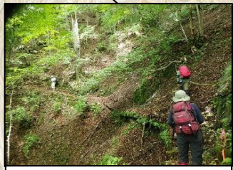
補助ロープが張ってあるが、登山道が崩落しているので注意が必要。