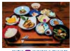
端場坊⑬で伝統的な宿坊体験。精進料理も楽しみの1つ。

精進料理 宿坊に泊まってぜひ楽しみたいのが、各坊自慢の旬や地元食材を生かした身体に優しい精進料理。女性や外国からの観光客にも好評です。