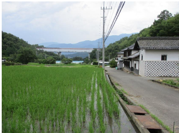
② ため池下流には人家や中央自動車道があり、大規模地震の際には甚大な被害のおそれがあるため、早急に対策を講じる必要がある。