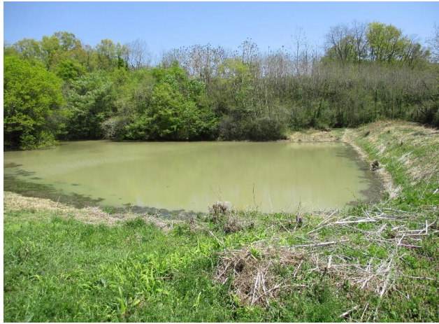
① 馬場堤ため池 全景 貯水量 12,000m 3 , 堤高 H=4.0m