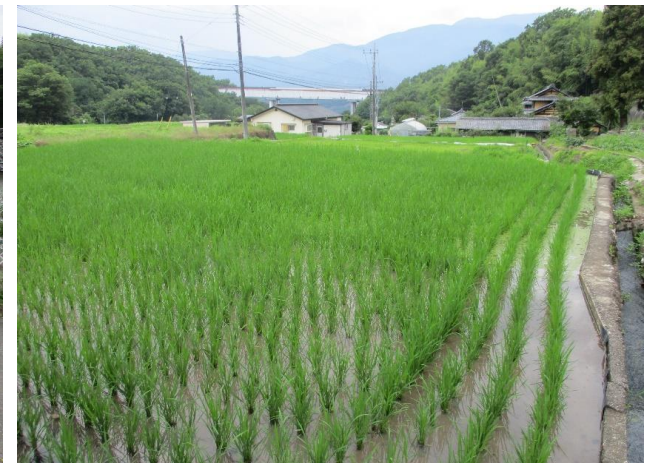
③ ため池下流の受益農地の状況。