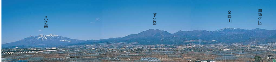
この写真は、中部横断自動車道・白根IC付近から撮影したものです

山梨県は周囲を急峻な山々に囲まれています。北東部に秩父山塊、西部に3,000m級の山々からなる南アルプス、南部には世界遺産富士山、そして北部には八ヶ岳、茅ヶ岳が広い裾野をひいています。これらの山地は山岳、森林、湖沼、渓谷などの優れた景観に富み、富士箱根伊豆国立公園などの自然公園にも指定されています。