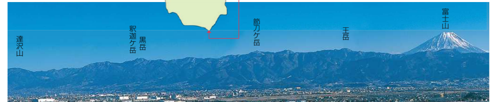
この写真は、中部横断自動車道・白根IC付近から撮影したものです