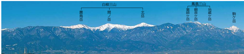
この写真は、八代ふるさと公園(笛吹市)から撮影したものです