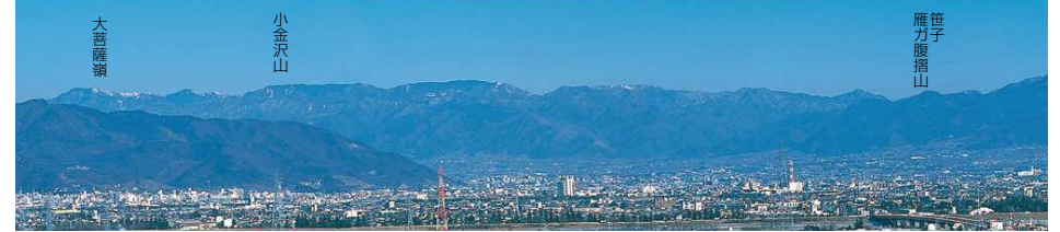
この写真は、中部横断自動車道・白根IC付近から撮影したものです