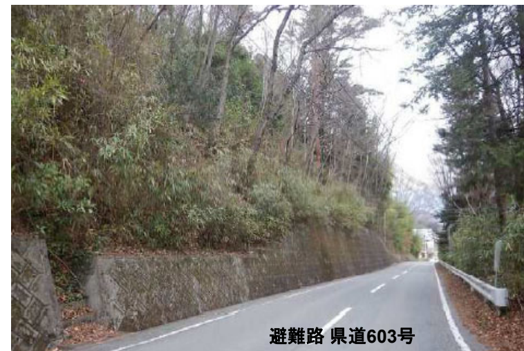
避難路 県道603号 斜面状況