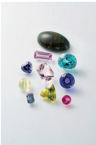
1. 「新しく増えた誕生石10種類」 所蔵：日独宝石研究所 山梨県立宝石美術専門学校 （右側下から3つ目）