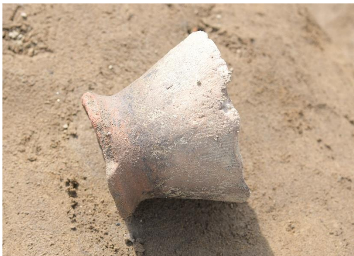
出土した古墳時代の土器