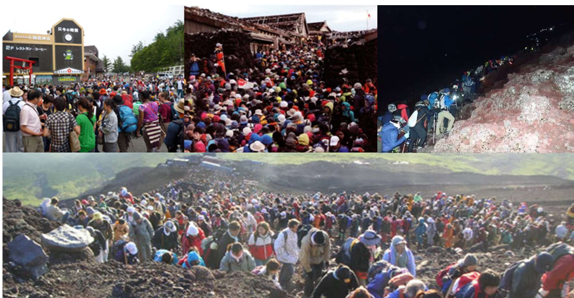
富士山の登山者・観光客

こうしたトラブル対処を更に難しくしているのが、富士山における電力・通信インフラの脆弱性等であり、基本的な遭難者対応から落石による大事故に至るまで基本は電話による対応となっている。