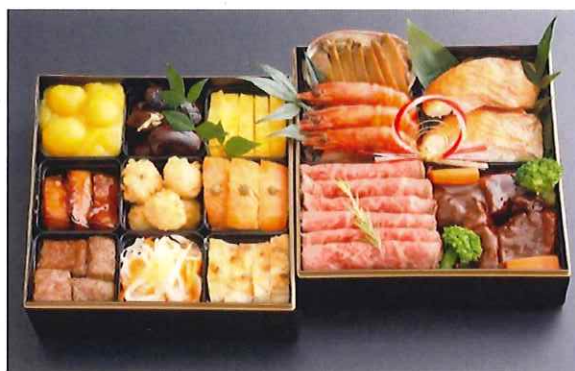
アマノパークス謹製