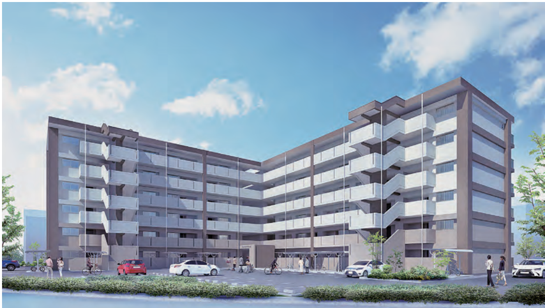
県営住宅 玉川団地 建替事業（完成予想パース）