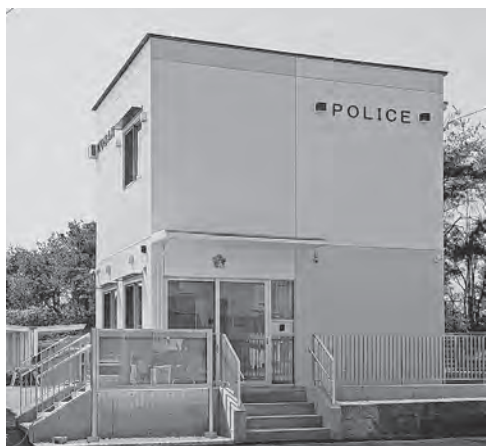
南甲府警察署小瀬交番