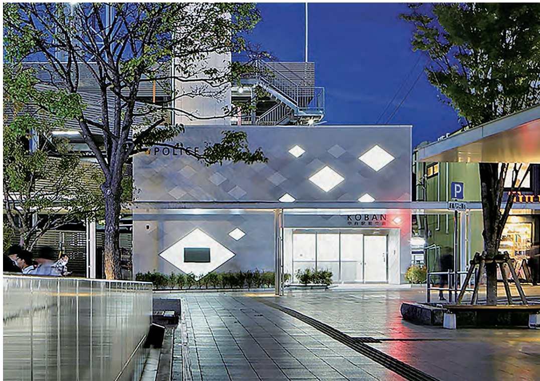
甲府警察署甲府駅前交番 外観