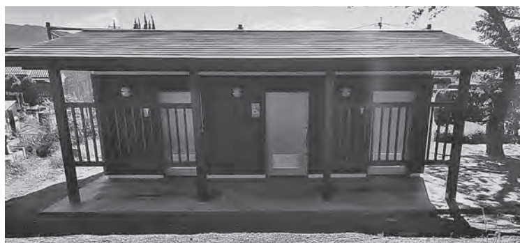
釜無川スポーツ公園屋外トイレ