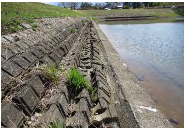
② 堤体の法面保護工の崩壊が見られるため、早急に改修の必要がある。