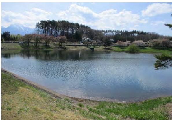
① 菅沼ため池 全景 貯水量 66,000m 3 、堤高 H=12.1m