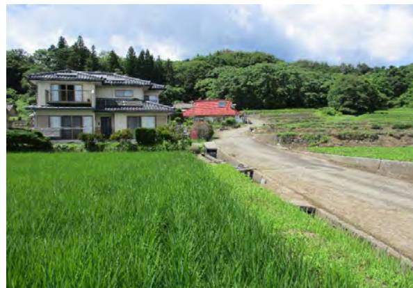
③ ため池下流には人家があり、大規模地震の際には甚大な被害のおそれがあるため、早急に対策を講じる必要がある。