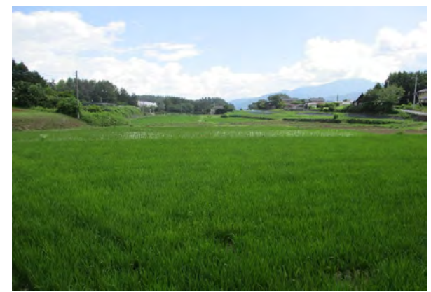
③ ため池下流の受益農地の状況