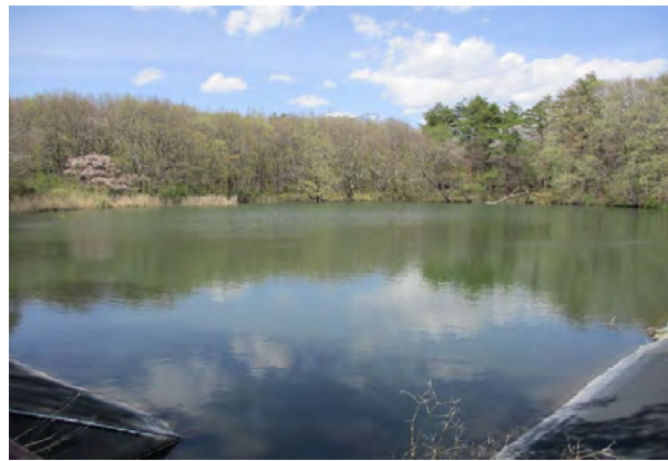
① 柿平貯水池 全景 貯水量 19,200m 3 、堤高 H=5.1m