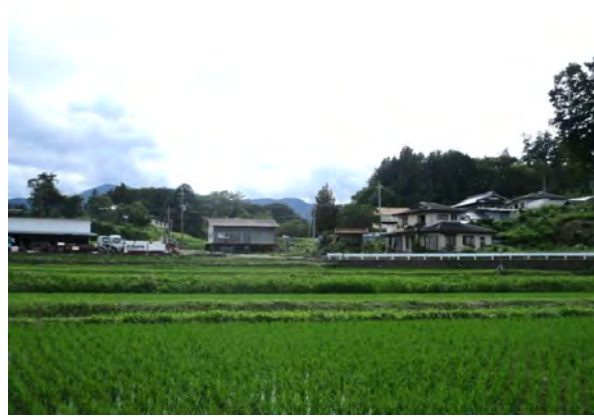
② ため池下流には民家があり、大規模地震の際には甚大な被害のおそれがあるため、早急に対策を講じる必要がある。