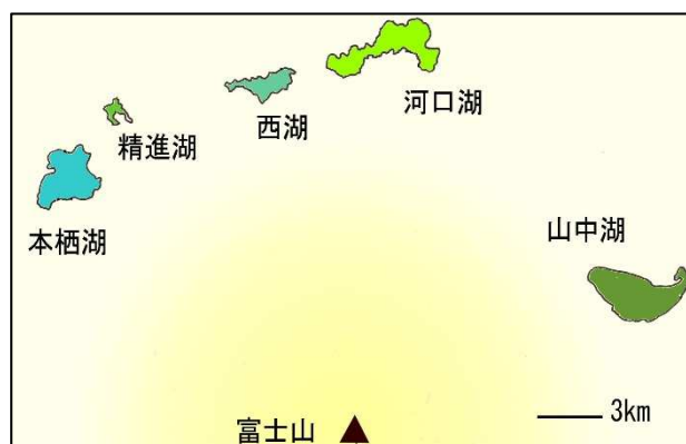
図1 富士五湖の位置関係

これらの背景の下に、本研究では富士五湖の特性を用いた環境学習プログラム（以下、プログラム）を考案し、小学校6学年を対象にして試行したので報告する。