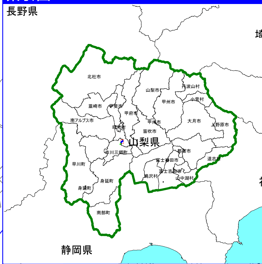
富士川水系 谷坂川 洪水浸水想定区域図（想定最大規模）