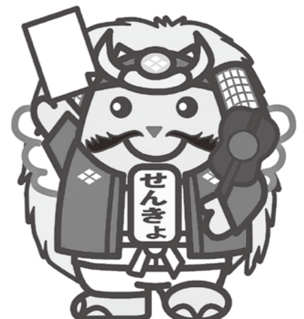
武田信玄めいすいくん