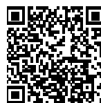
▲省エネ通知のページQRコード