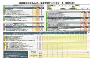
▲省エネチェックシート