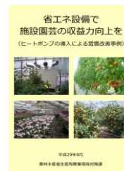
▲省エネで収益力向上を