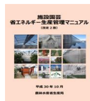
▲省エネマニュアル