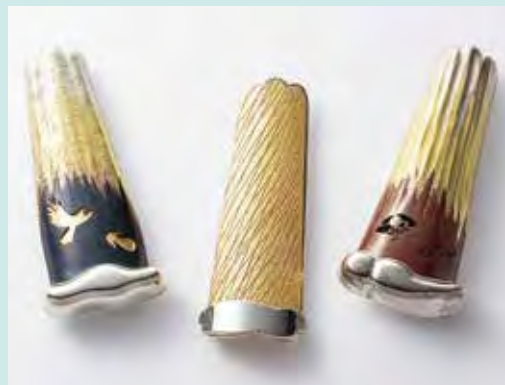
「一富士二鷹三茄子」ブローチ

『金属の表情 宝美校長とその仲間たち』と併せて、ジュエリーと工芸品の様々な表情をご覧ください。