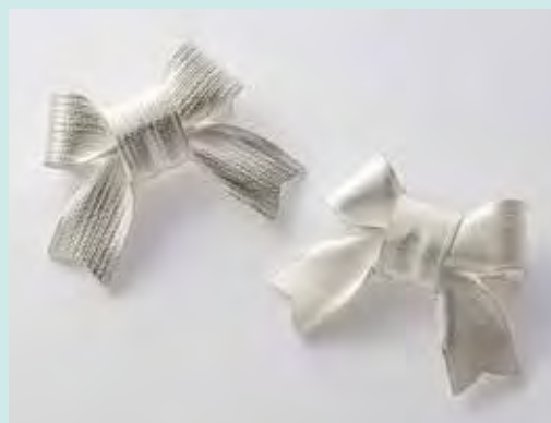
「非凡なりボン」ブローチ