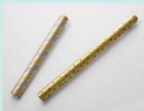
打ち込み象嵌によるブローチ