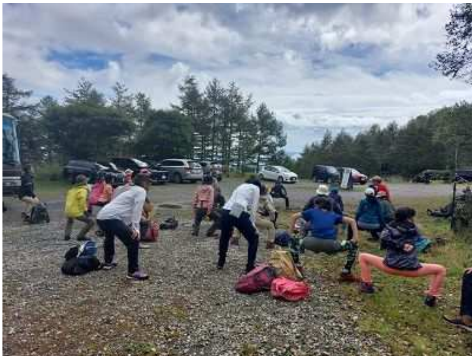
入念な準備体操・ストレッチをしてから...