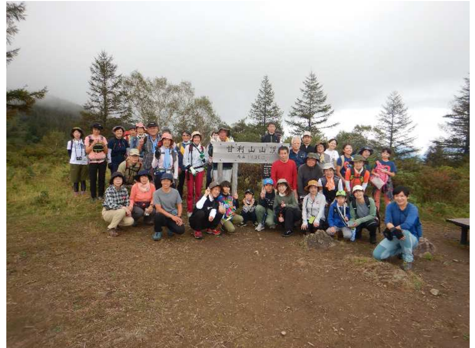
山梨百名山・甘利山踏破！