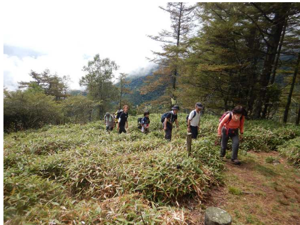
気合で登り切り・・・