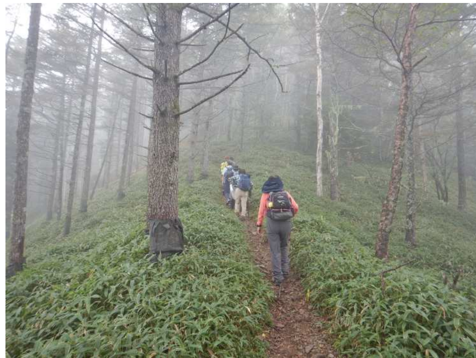
安心して千頭星山へと向かいました