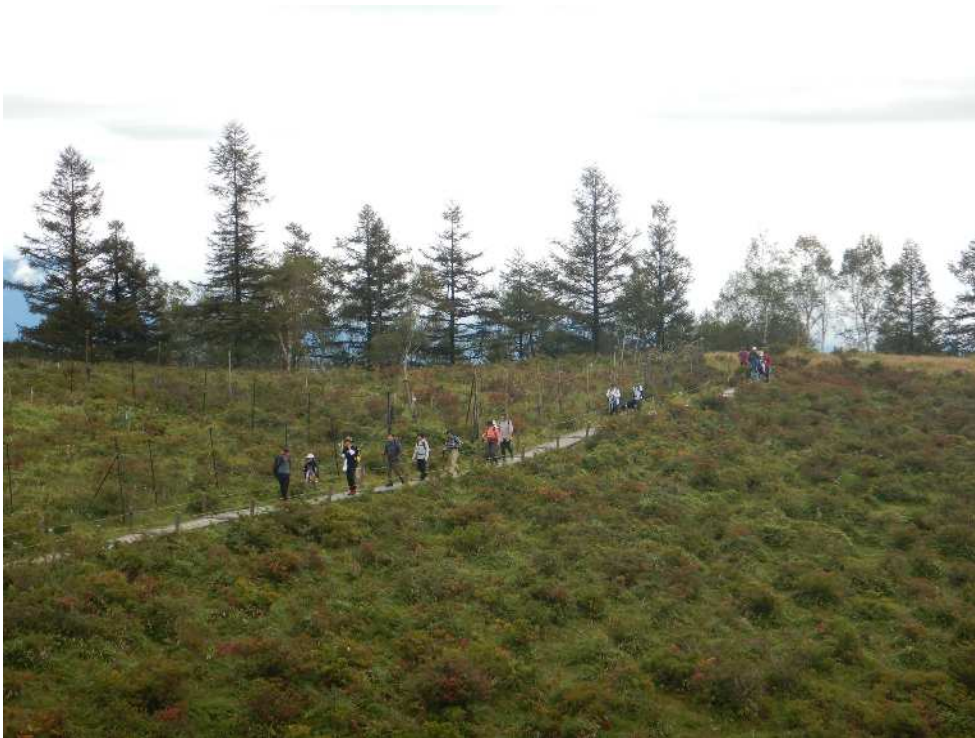
甘利山山頂手前の木道を快適に進みます