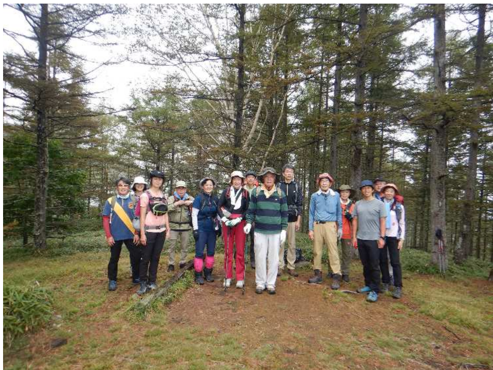
奥甘利山に到着！（1班の皆様）