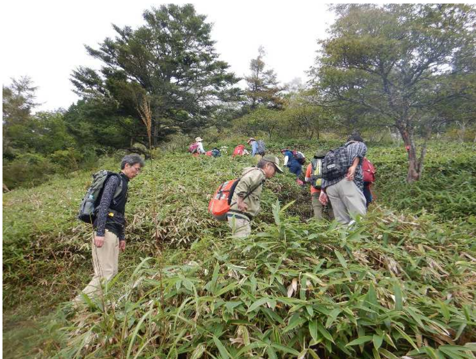
奥甘利山山頂直下の急斜面も・・・