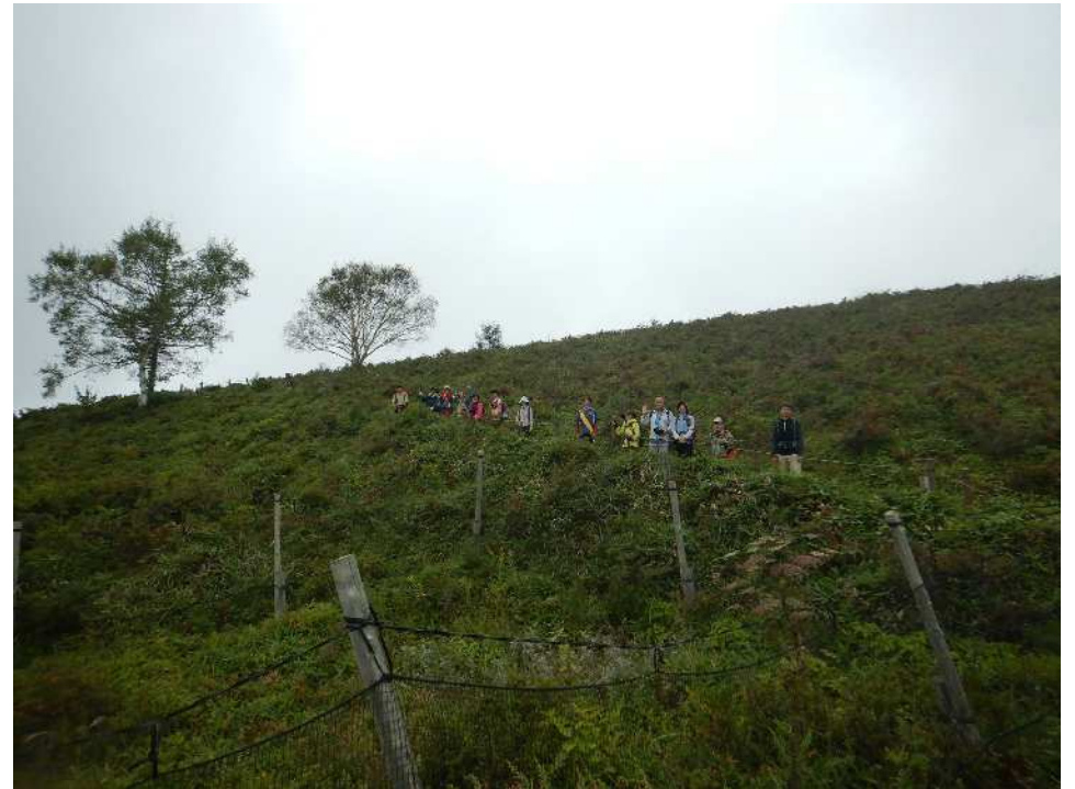
頂上手前の斜面にて