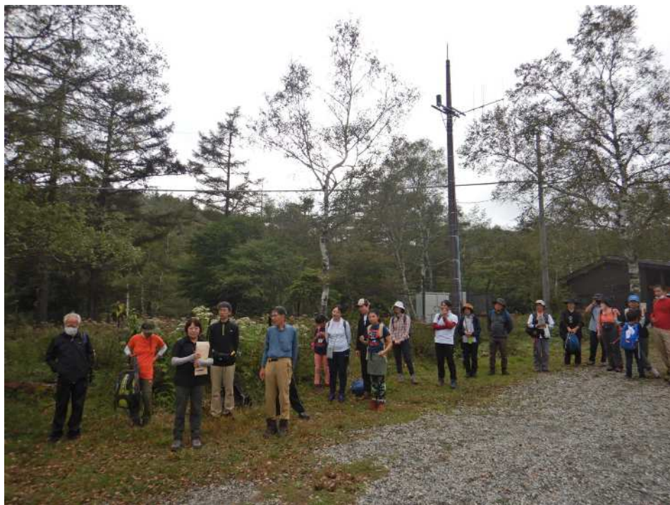
今日一日お疲れ様でした！