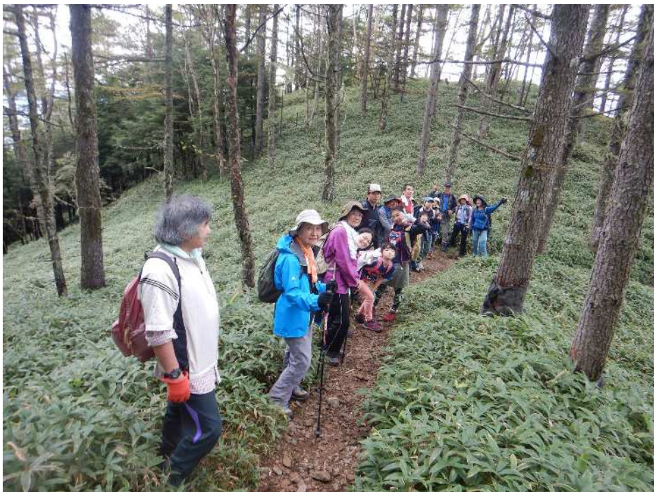
途中の大西峰をゴールにした3班の皆様も下山開始！