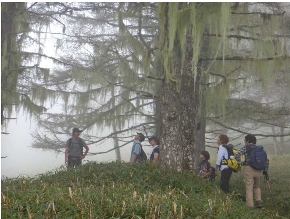
サルオガセの垂れ下がるカラマツの巨木をすり抜け・・・