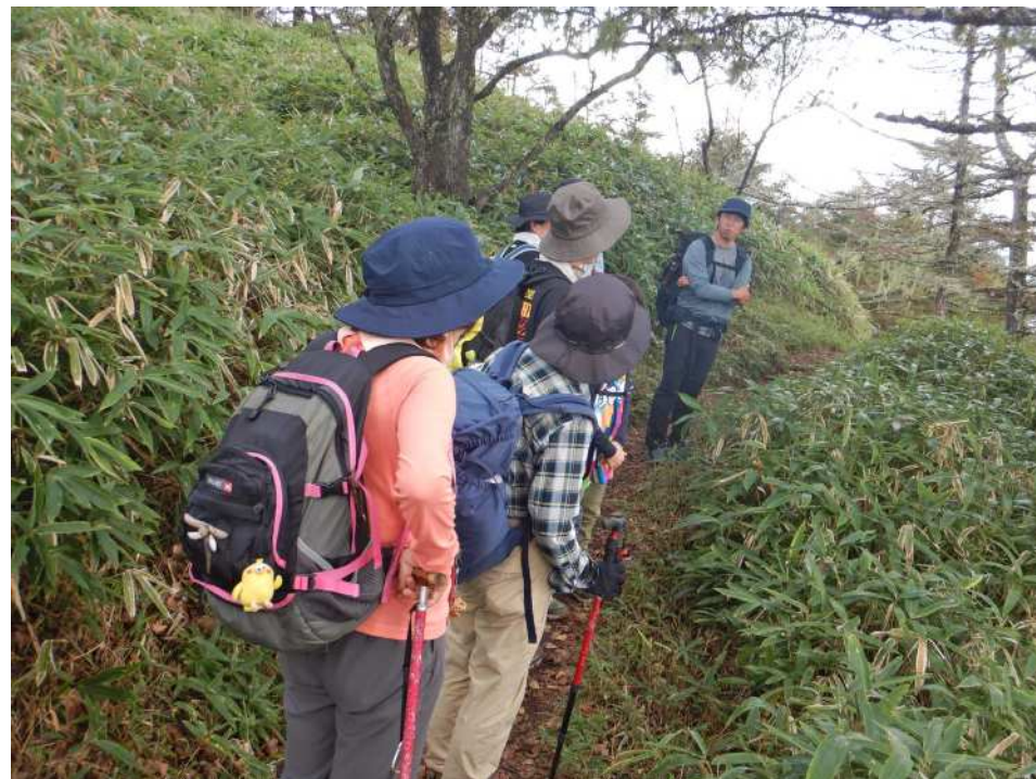
ガイドさんの軽妙なトークも楽しかったです！