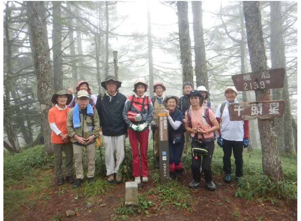
無事、山梨百名山・千頭星山に登頂！1班の皆様、お疲れ様でした！