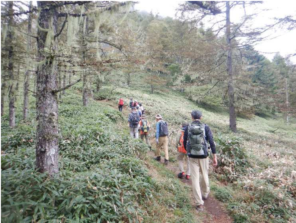
山頂手前の急斜面を頑張って登って・・・