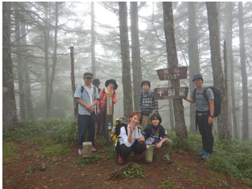
2班の皆様も山頂に到着！お疲れ様でした！