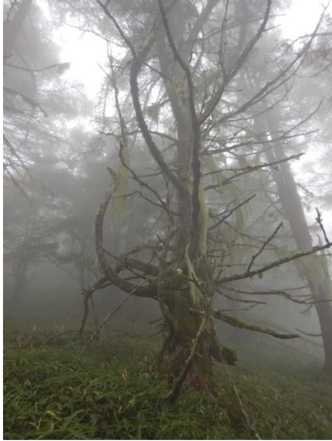
霧の中の幻想的な風景