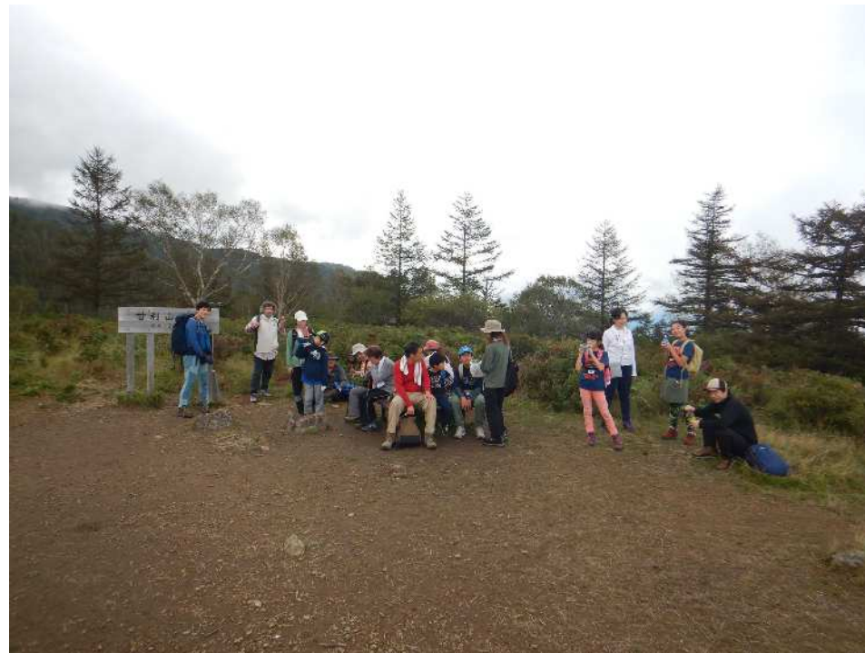
3班の皆様も本日2回目の甘利山登頂！