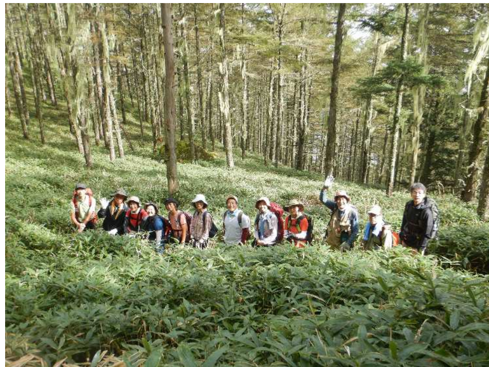
1班の皆様、元気な笑顔ありがとうございます！