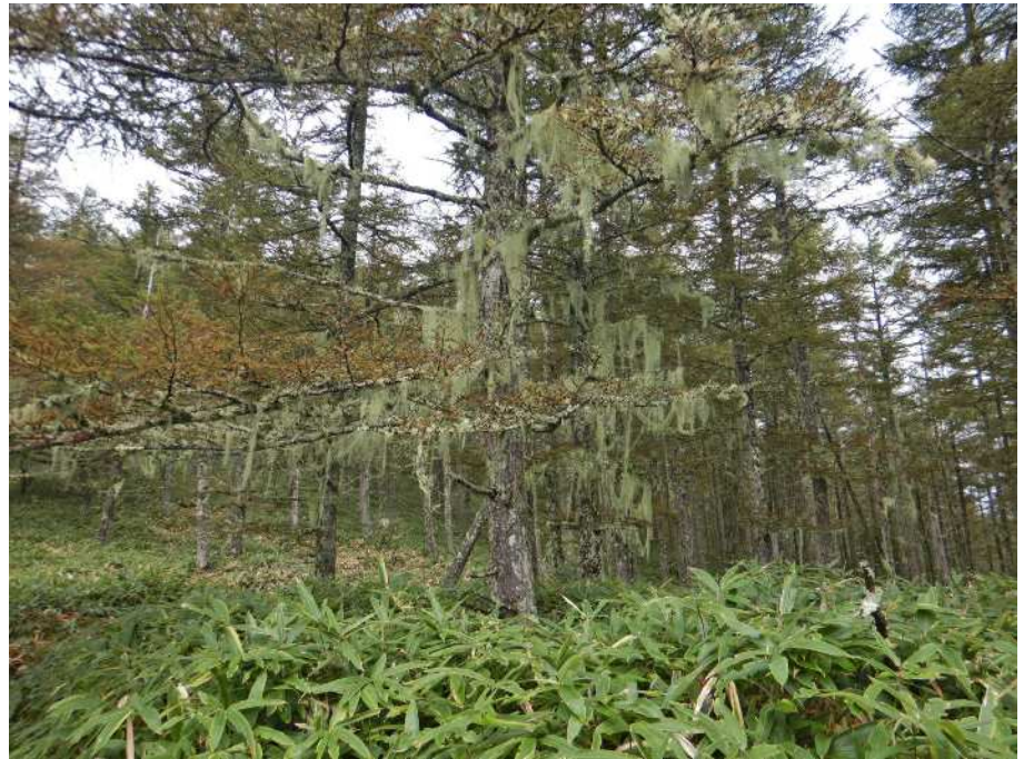
カラマツの枝から垂れ下がる黄緑色の網状のものは「サルオガセ」という地衣類です。空気がきれいな場所でなければ生育できません。