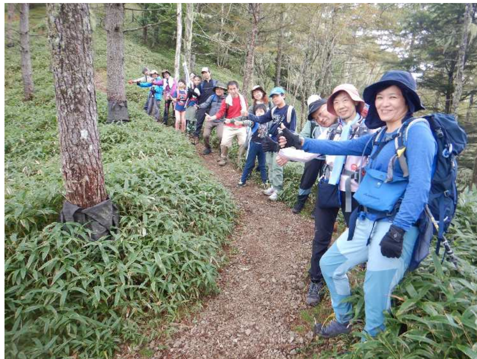
お疲れのところ、爽やかな笑顔ありがとうございます！