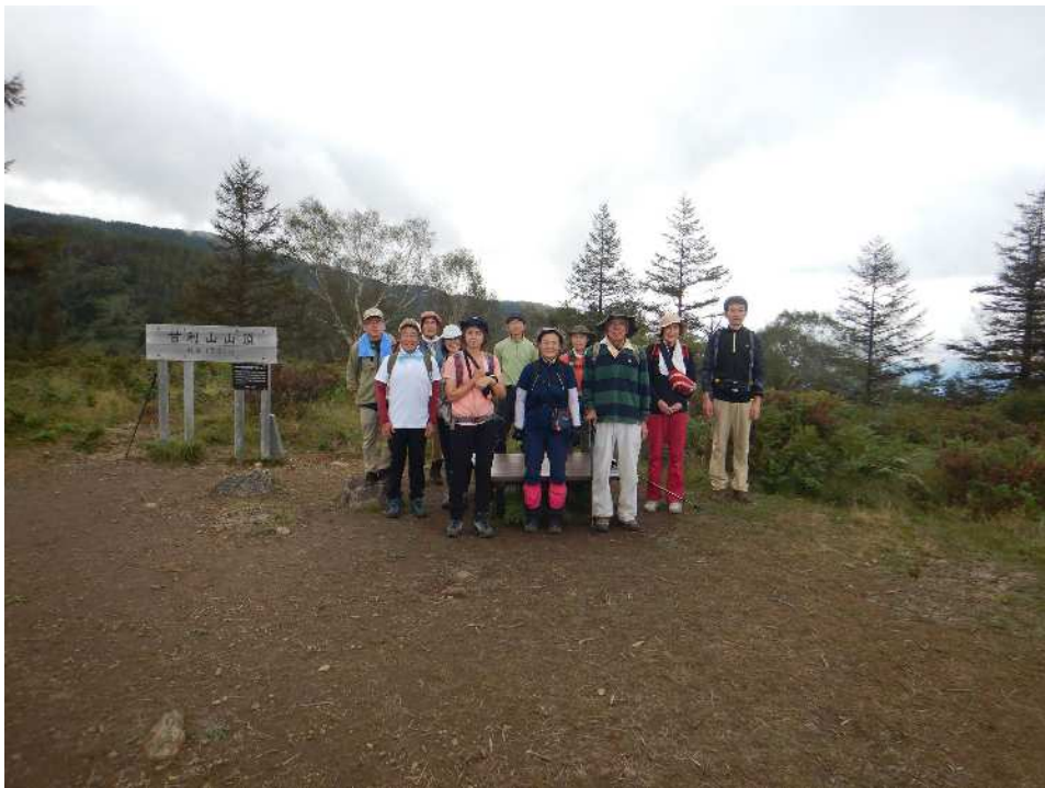
そうこうしているうちに、2回目の甘利山（1班）