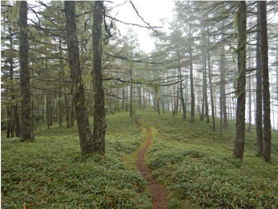
緩やかな尾根上の一本道