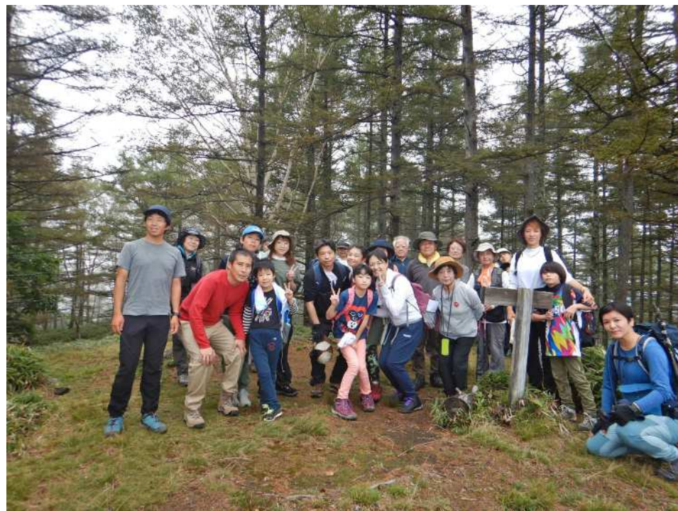
清々しい笑顔の2・3班の皆様