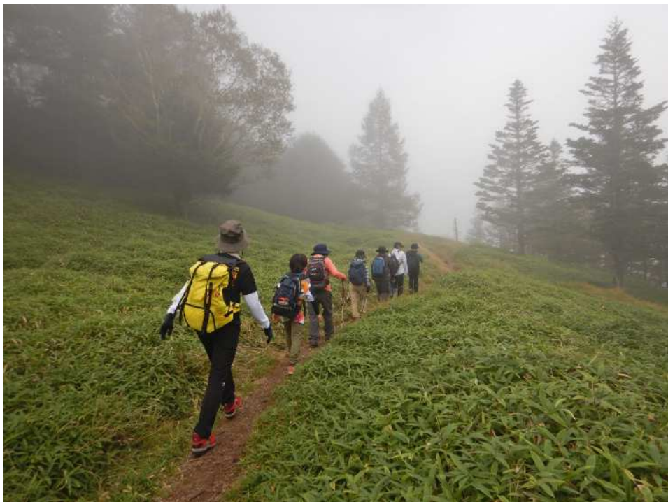
山頂で昼食と休憩を取ったあと、下山開始！