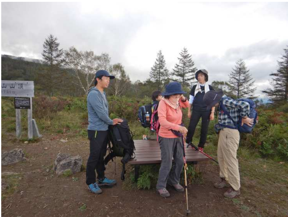
2班の皆様も甘利山到着！