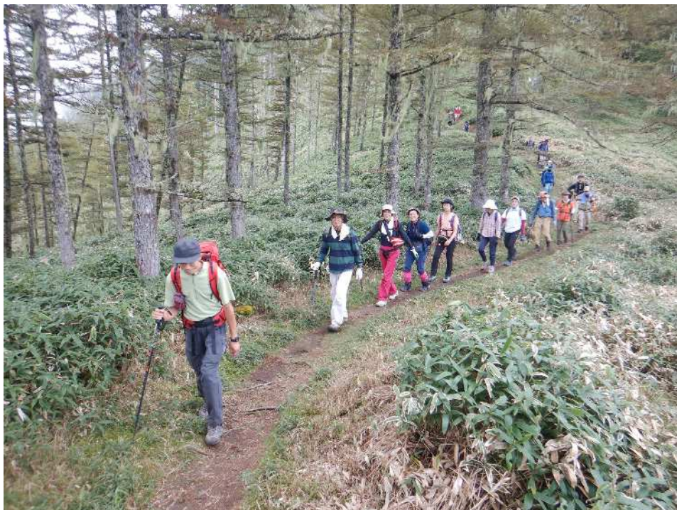
長い行列を組んで、リズムよく下ります