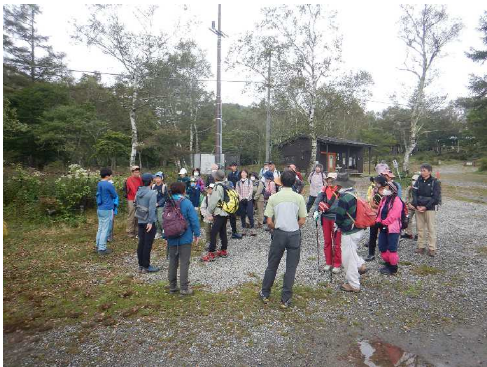
甘利山グリーンロッジ前の広場での開始式

○空は厚い雲に覆われ、時折小雨や濃い霧に見舞われるあいにくの空模様でしたが、34名の皆様のご参加のもと、楽しい山旅に行ってきました！