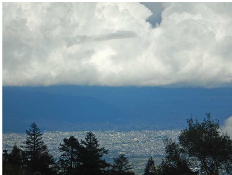
ほんの一瞬、甲府盆地を眺められました！