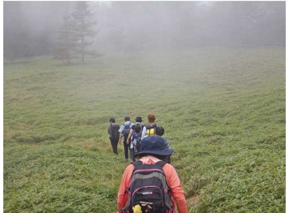
目指す千頭星山はあと少し