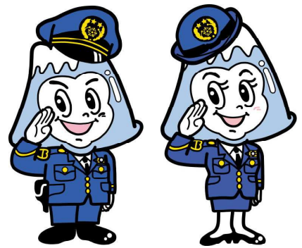
山梨県警察シンボルマスコット