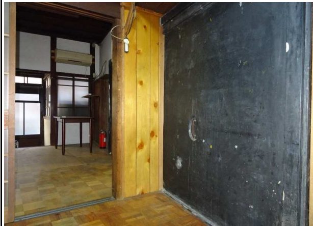
1階 台所 蔵戸