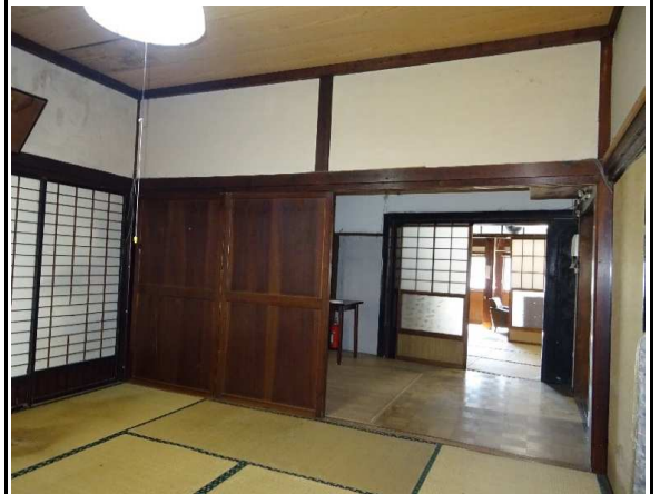
1階 中座敷から前の間をみる