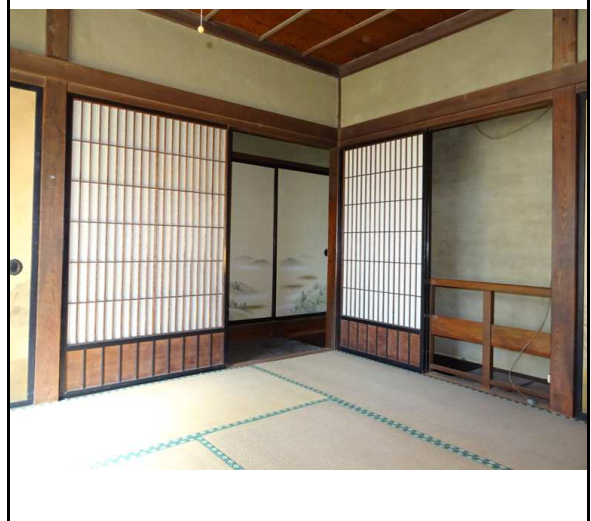
2階 座敷から階段をみる