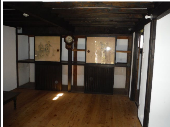
⑳ 蔵 内観