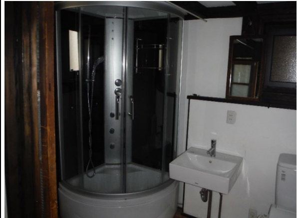
㉒ 蔵 シャワートイレ