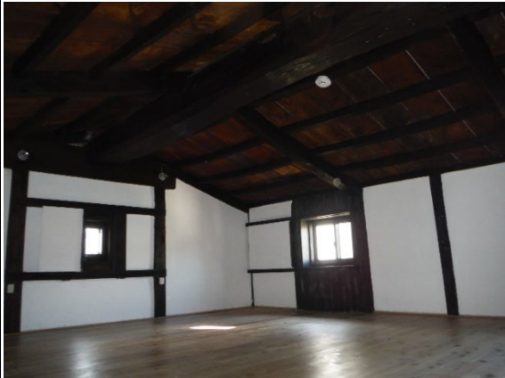
㉑ 蔵 内観ロフト