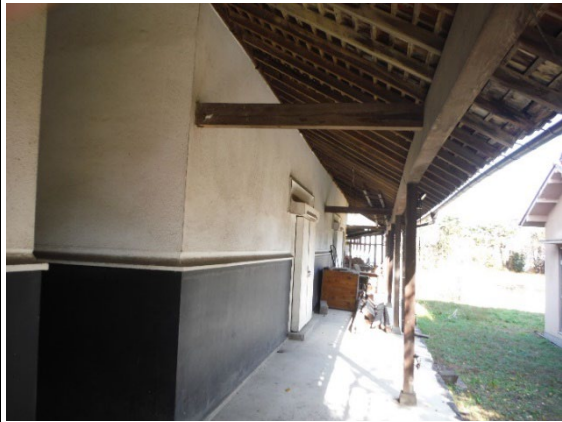
⑱ 蔵 外観2