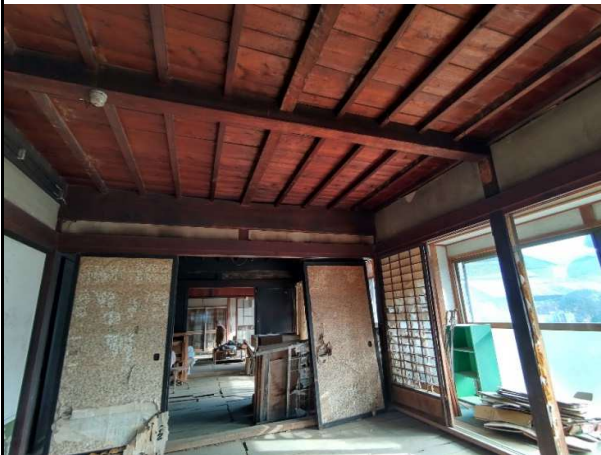
内観 根太天井の様子