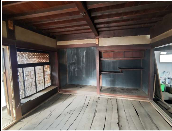
内観 座敷床の間の様子