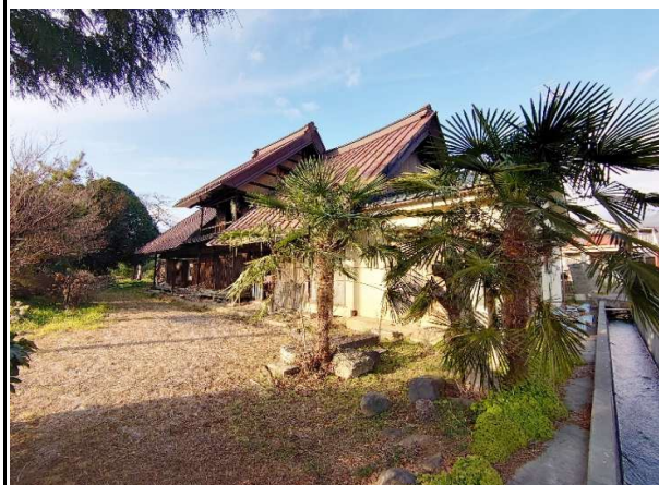
駐車場・庭 東側より臨む