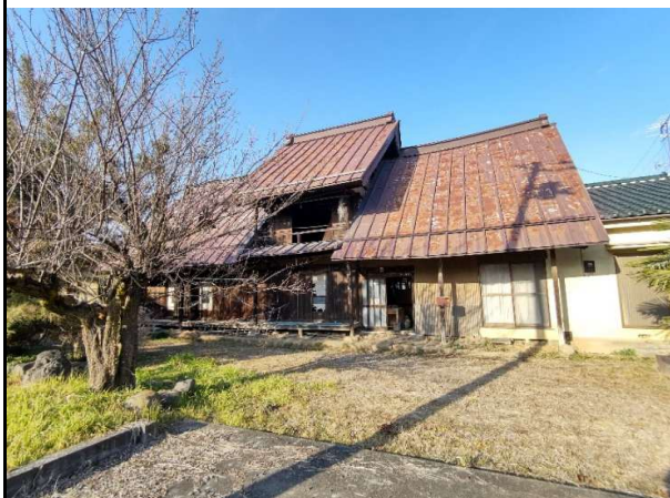
建物外観 南面と駐車場・庭