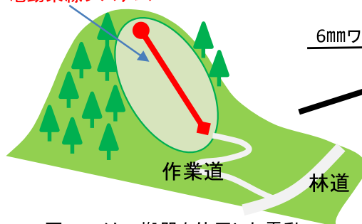
図 マイクロ搬器を使用した電動架線システム使用場所の概念図(車は作業道までしか入れない。薄緑色の急傾斜施業地で使用)