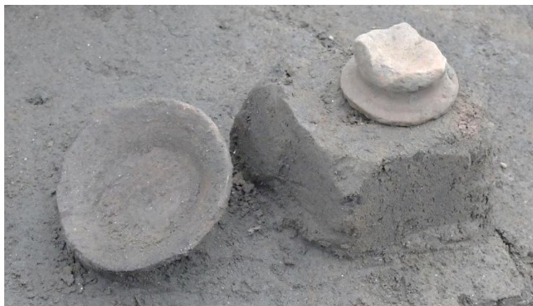
平安時代から鎌倉時代頃の土器