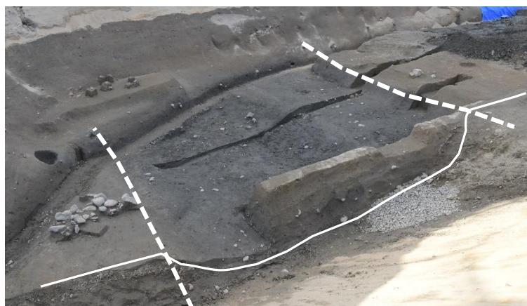
戦国時代の溝のあと