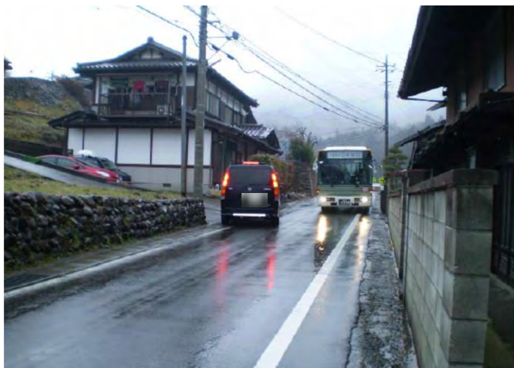
① 下瀬戸集落内 (幅員狭小・バスのすれ違い困難)