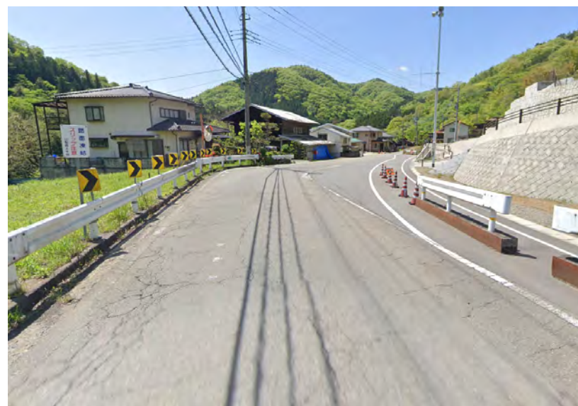
② 下瀬戸集落内 (一部改良済み)