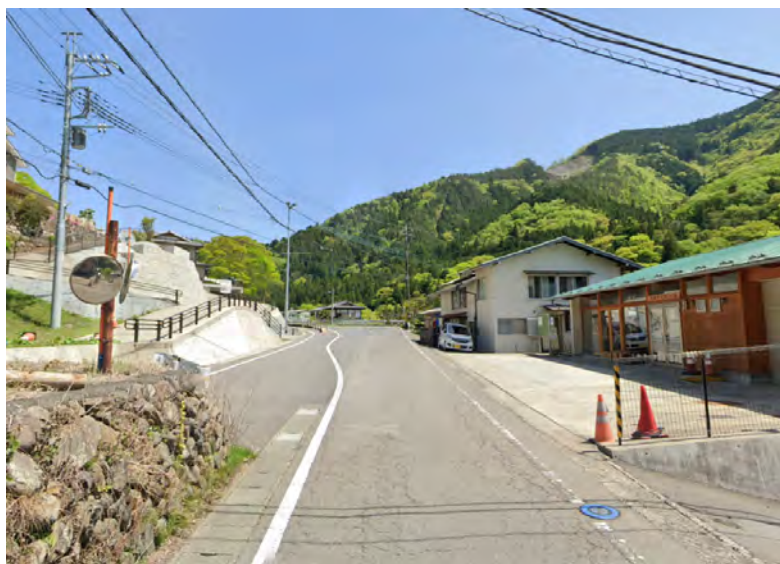
① 下瀬戸集落内 (一部改良済み)