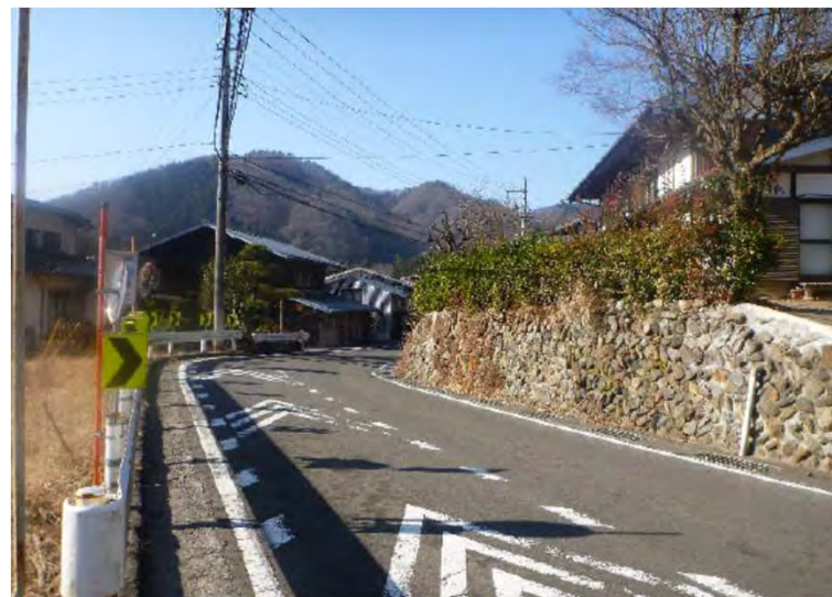
② 下瀬戸集落内 (幅員狭小・線形不良)