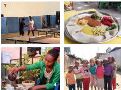
1.「練習風景」 2.定番料理パヤインナット(インジェラの上に野菜や豆の煮込みをのせたもの) 3.お宅訪問 4.エチオピアコーヒー 5.近所の子どもたち