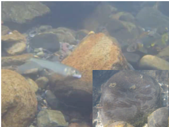
図2 餌を食べるアユと食べた跡が付いた石