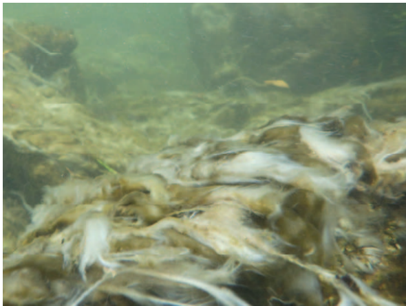
図1 異常増殖したミズワタクチビルケイソウ

近年、北米原産のミズワタクチビルケイソウ Cymbella janischii の繁茂がアユ釣り場で確認されるようになった。本種は大型の珪藻で、増殖すると石の表面に群体を形成し、異常増殖するとマット状となり川底を覆い尽くしてしまう(図1)。アユは石の表面に生えたラン藻や珪藻を口で削り取って食べるが(図2)、肥厚した群体は摂餌することができないと考えられ、アユへ与える影響が懸念された。そこで、本研究では本種が放流アユの定着に与える影響について調査した。