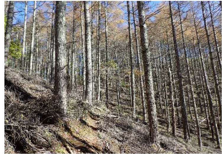
主伐予定箇所 96林班に6小班