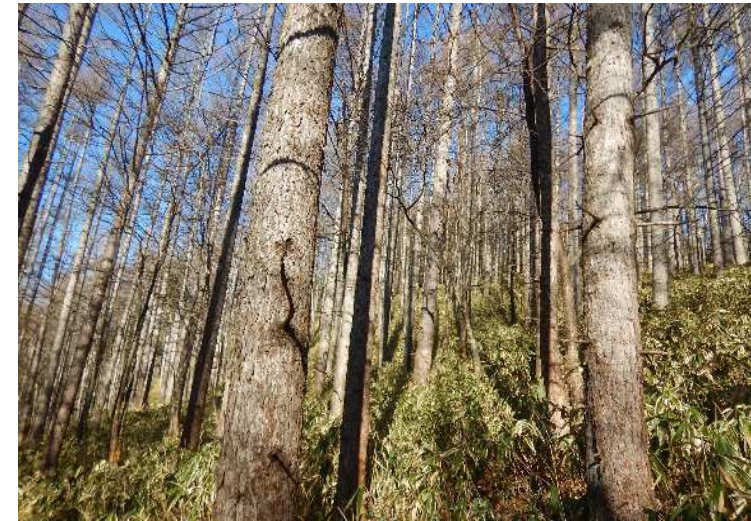
収穫間伐予定箇所 95林班と2小班