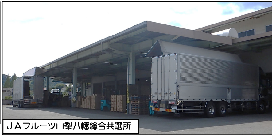
JAフルーツ山梨八幡総合共選所