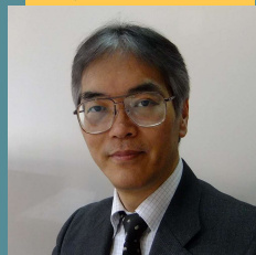
ブランド総合研究所 代表取締役社長