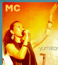
富士山世界遺産国民会議 事務局長