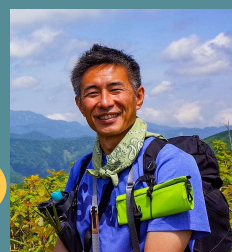
山と渓谷社 法人営業部

ブランドの調査・コンサルティングの専門企業である同社を2003年に設立。地域ブランド戦略、CSRやSDGsの課題解決等にも取り組む。講演活動も積極的に行い、消費者の視点によるブランド戦略について説く。令和5年度には富士山五合目の来訪者アンケートを同社が実施。