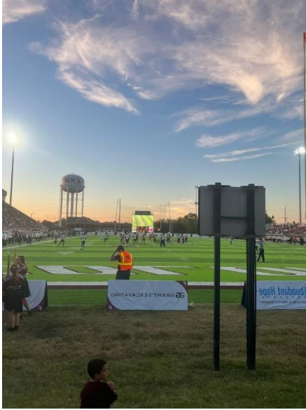
←アメリカンフット ボール観戦