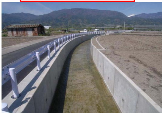
農業用排水路の整備