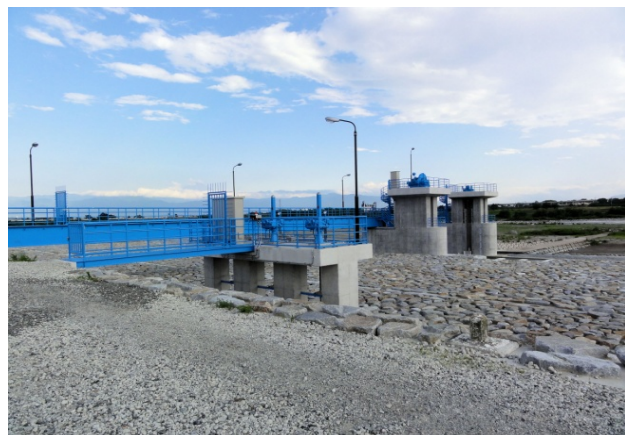
かんがい排水事業