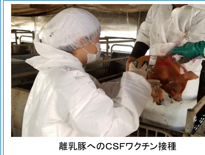
離乳豚へのCSFワクチン接種