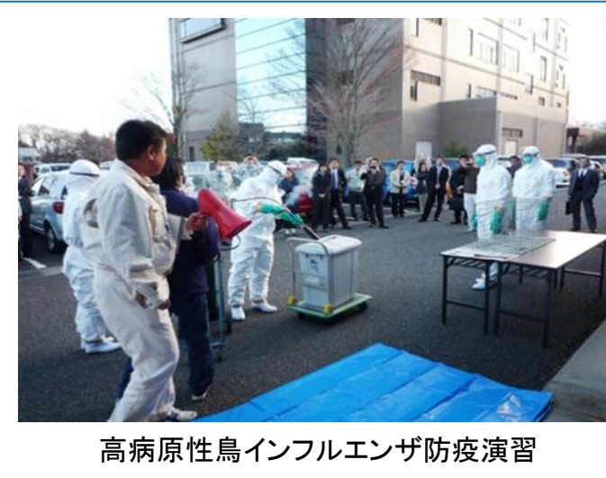
高病原性鳥インフルエンザ防疫演習

山梨県 福祉保健部 福祉保健総務課 総務経理担当 TEL 055-223-1441 農政部 農政総務課 総務経理担当 TEL 055-223-1581 〒400-8501 甲府市丸の内1丁目6-1 http://www.pref.yamanashi.jp