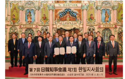
河口湖音楽と森の美術館での記念撮影

植樹を行い、長崎知事は「植樹した木国の友好関係の強化・深化、未来のさまざまな分野における交流の活性化を期和7年に韓国で開催される予定です。