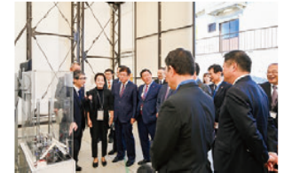
米倉山電力貯蔵技術研究サイトを視察