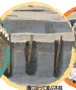
溝に沿って並ぶ木柱