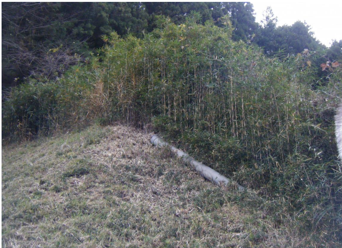
写真2 (対象物件「862-1」東側を南方向から撮影)