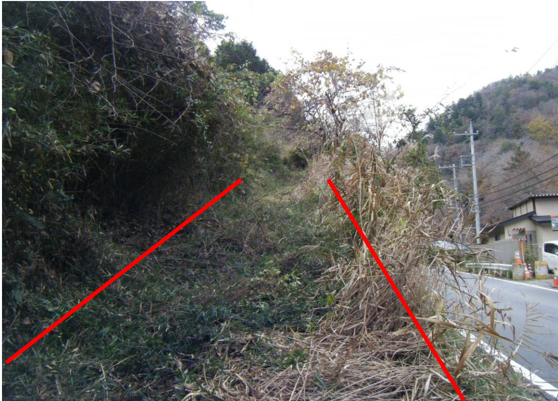
写真14 (対象物件「862-1」東側を北方向から撮影)