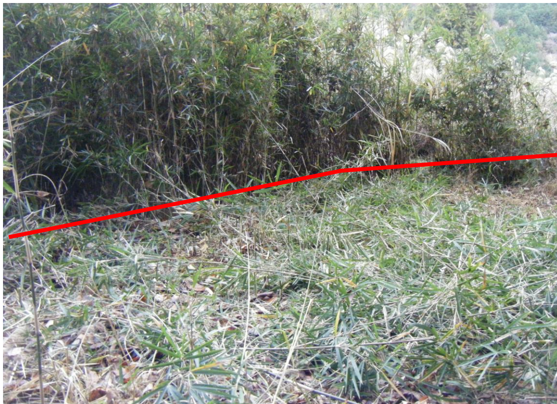
写真10 (対象物件「862-1」北東側進入路を北方向から撮影)