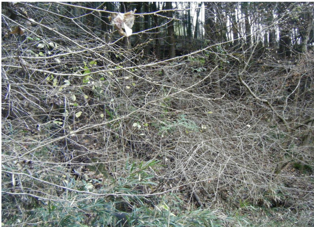
写真18 (対象物件「862-8」北側を北方向から撮影)