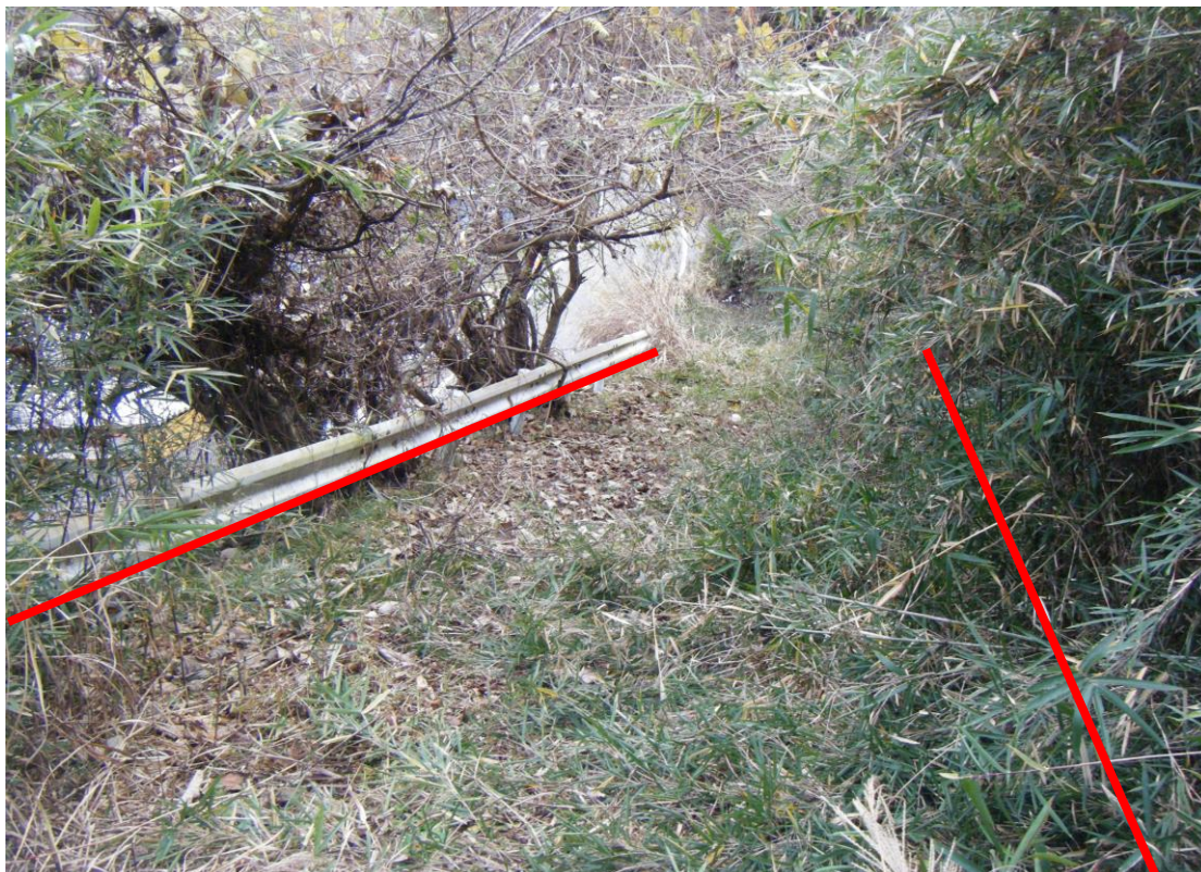
写真12（対象物件「862-1」東側進入路を南方向から撮影）