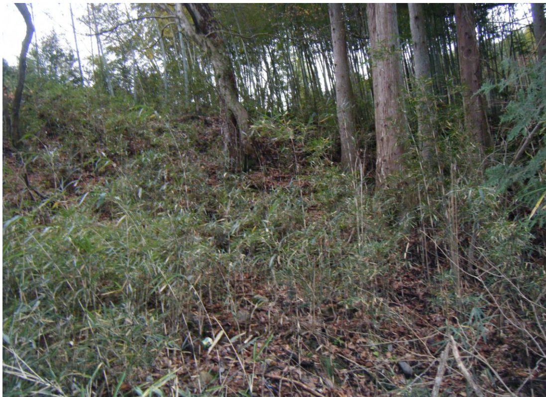
写真16 (対象物件「862-8」東側を南東方向から撮影)