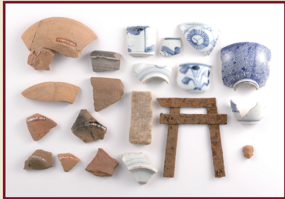
▲行者平遺跡出土品（江戸～明治時代）

「呪い（まじない）」は、神秘的なものの力を借りて災いを除く、あるいは引き起こすための術で、原始・古代から人々の生活の身近にあつてさまざまな信仰や習俗と結びついてきました。本展では、山梨県内各地で発掘されたマツリや呪物にかかわる出土品を通して、長い歴史の中で形や方法を変えていったまじないの世界をひもときます。