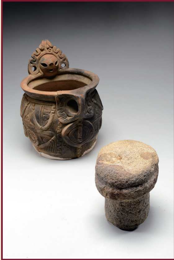
▲海道前C遺跡出土品（縄文時代）