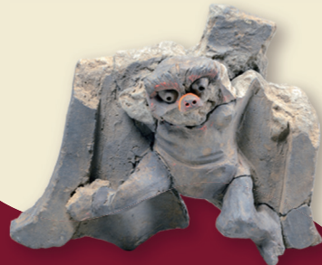
▲金箔付鬼瓦 甲府城跡（江戸時代）