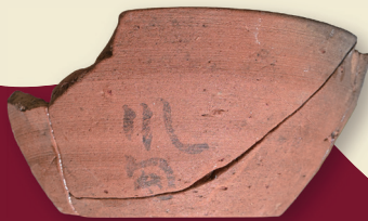
▲墨書土器「川勾（かわわ）」 四ツ塚古墳群（平安時代）

Yamanashi Prefectural Archaeological Museum